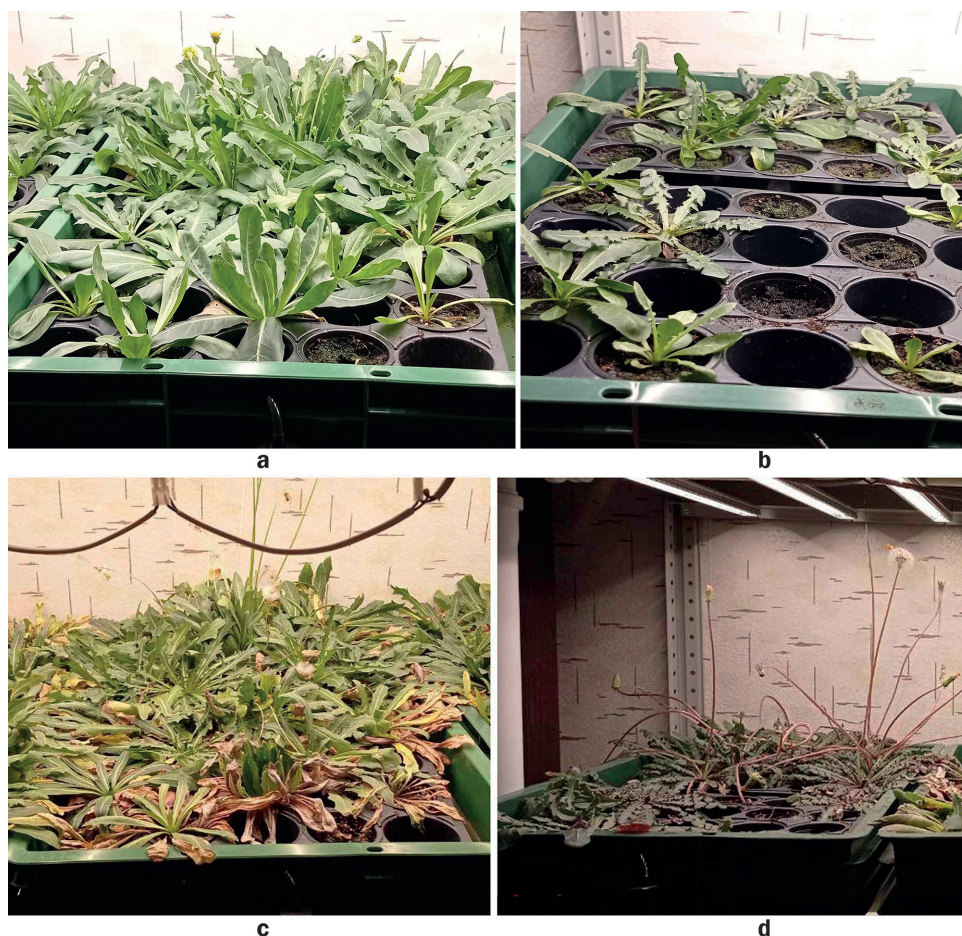
Рис. 1. Кок-сагыз через 1,5 месяца (а) и 3 месяца (с) после посева семян на грунт; крым-сагыз (в ближнем блоке – Taraxacum pobedimovae , в дальнем блоке – Taraxacum hybernum ) через 1,5 месяца (б) и 3 месяца (д) после посева семян на грунт

Наибольшая сырая масса корней была характерна для кок-сагыза и козлотородника (рис. 2, а). Оба вида крым-сагыза лишь немного уступали по данному параметру. Почвенные растения кок-сагыза набирали очень маленькую сырую массу – примерно в 10 раз меньше, чем гидропонные варианты (см. рис. 2, а). Далее корни