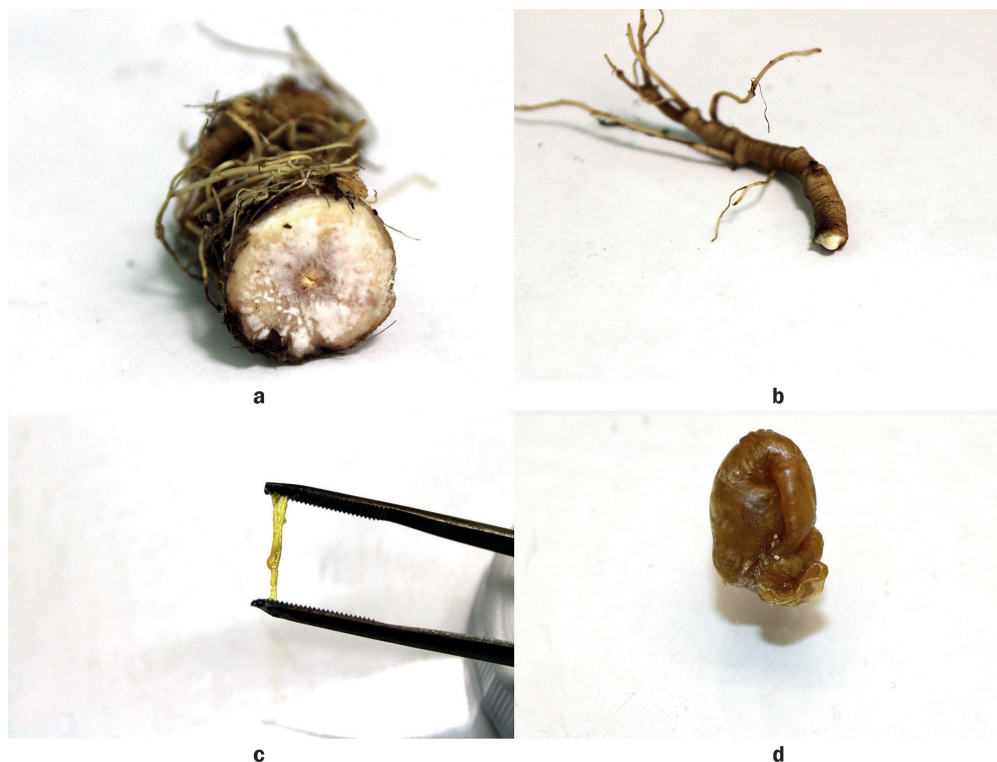
Рис. 4. Просачивание латекса из разрезанных корней кок-сагыза, выросших в условиях гидропоники (а, b), растягивание каучука, выделенного из гидропонных растений Taraxacum kok-saghyz (с), шарик каучука диаметром около 2 см, выделенного из нескольких корней Taraxacum kok-saghyz (d)