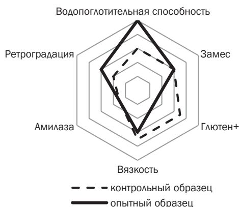
Рис. 3. Радиальная диаграмма

Для более наглядного описания реологического профиля образцов также проведена графическая интерпретация результатов с применением функции Mixolab Profiler. Для построения радиальной диаграммы (рис. 3) использовали интеграционные индексы профайлера исследуемых образцов (табл. 4).